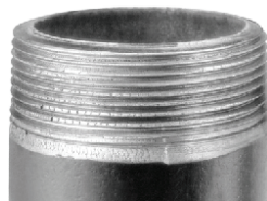
Rosqueado com Cossinetes de Aço Rápido do Concorrente