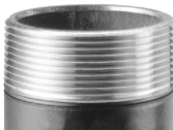
Rosqueado com Cossinetes RIDGID "GOLD"