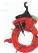
Mod. 728/928 **