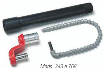
Mods. 343 e 768

Um transmissor telescópico (41" até 50") para acoplar os cabeçotes engrenados às rosqueadeiras 300C, 535-T, 1224 e 1233. Utiliza o torno modelo 460 e o Lubrificador 418.