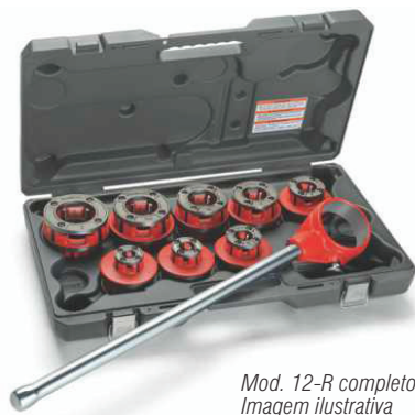
Mod. 12-R completo Imagem ilustrativa