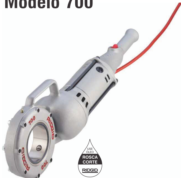
Conjunto 700 de 1/2" - 2"