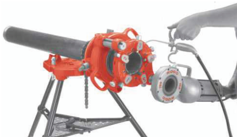
Unidade de Força 700