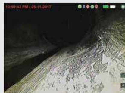
Câmera sem TruSense

* Os monitores de gravação digital da série CSx incluem RIDGID SeeSnake CS6x Versa, SeeSnake CS65x e SeeSnake CS12x