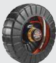
Tambor rM200B D2B N.º de catálogo 47538