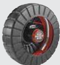
Tambor rM200 D2A N.º de catálogo 47548