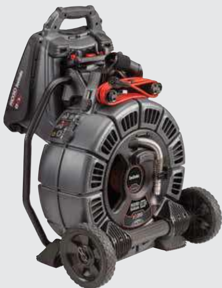
SeeSnake rM200 com CS65x encaixado para fácil transporte.