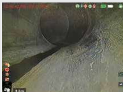
Câmera com TruSense