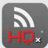
HQx Live App*

IOS é uma marca comercial ou marca comercial registrada da Cisco nos Estados Unidos e em outros países e é usada sob licença. Android é uma marca comercial registrada da Google LLC.